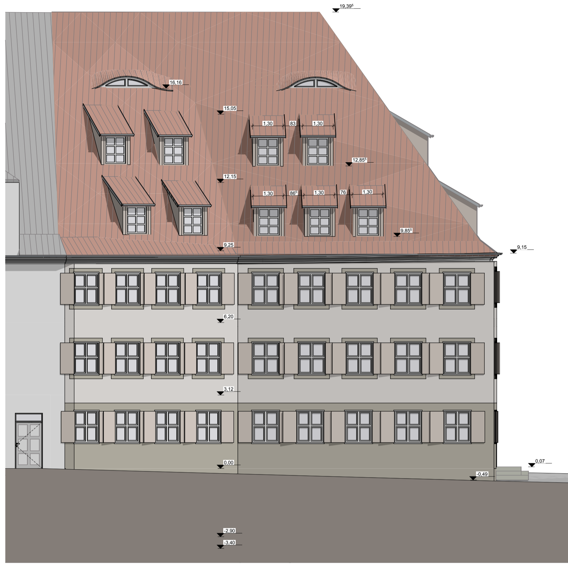
Ansicht Süd M 1:100