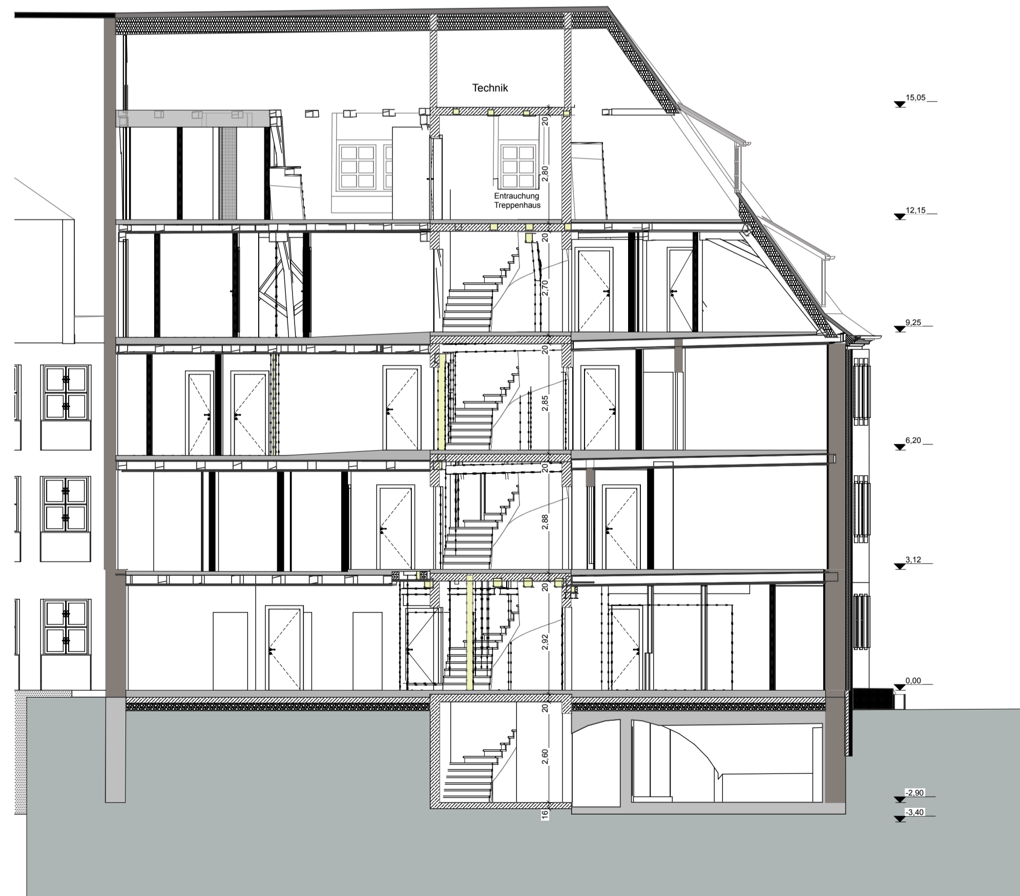
Schnitt A-A M 1:100