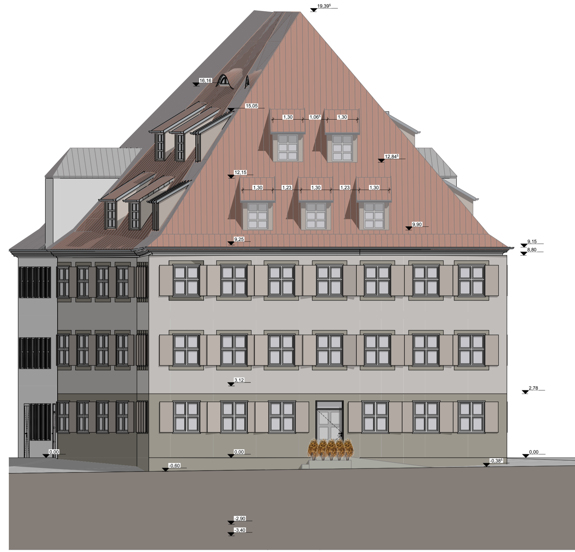
Ansicht West M 1:100