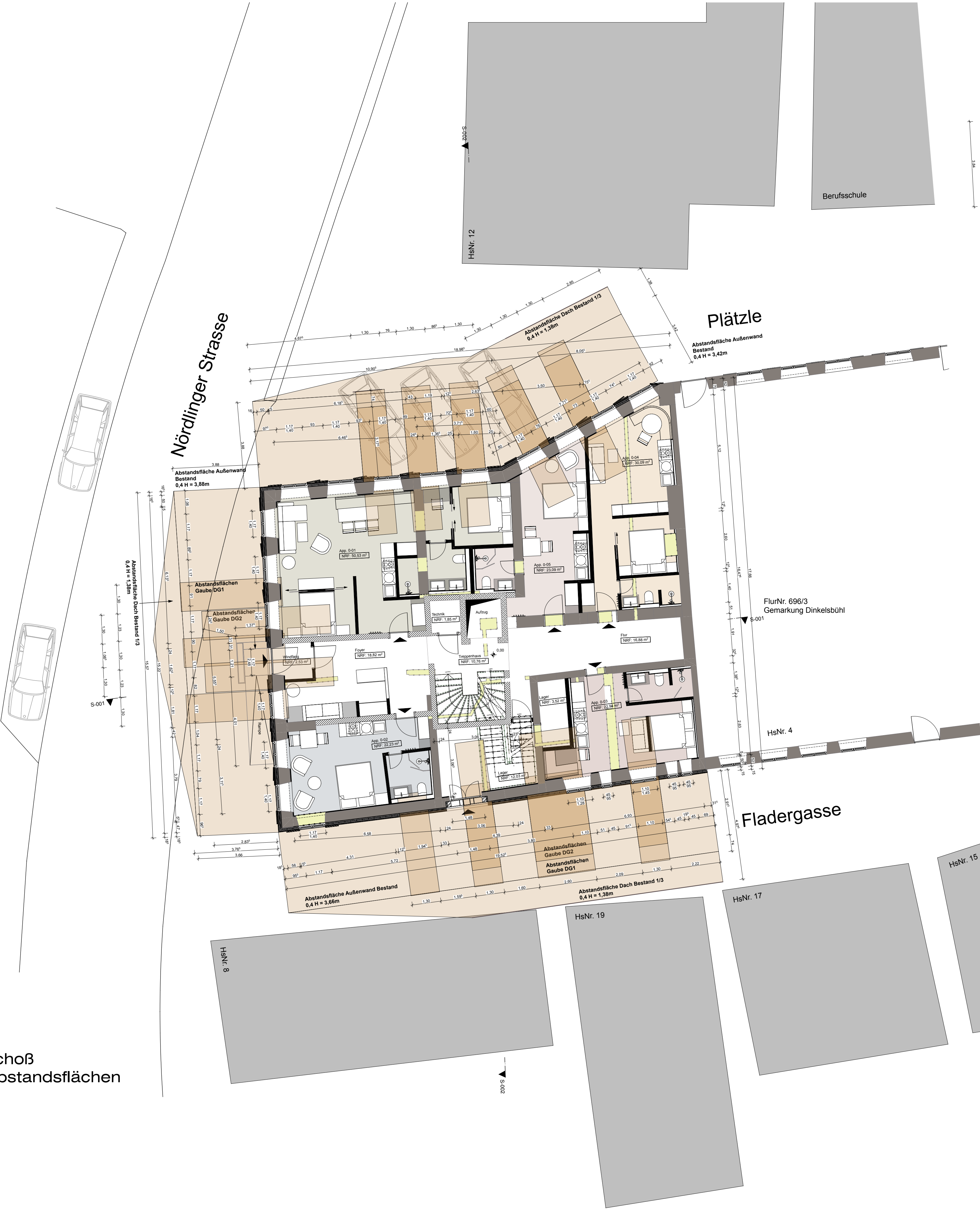
Grundriss Erdgeschoß mit Umgriff und Abstandsflächen