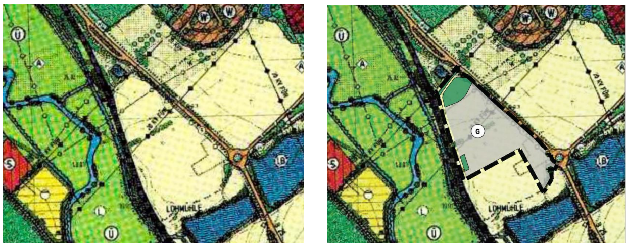
Abbildung 1: links: derzeit wirksamer Flächennutzungsplan, rechts: 22. Änderung des Flächennutzungsplanes

Der Bereich der Änderung entspricht dabei dem Geltungsbereich des parallel aufgestellten Bebauungsplanes.